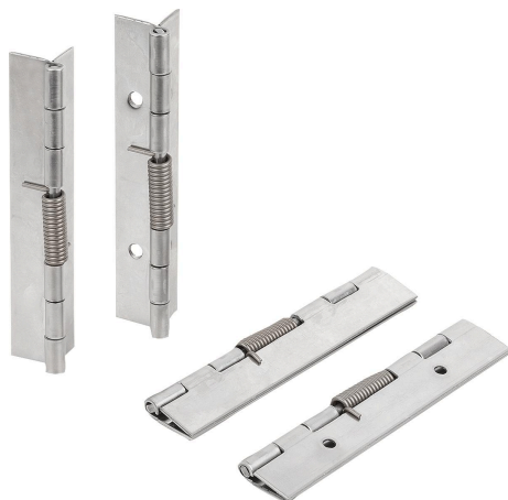
带闭锁弹簧的铰链