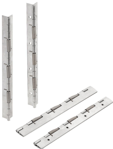
带闭锁弹簧的铰链