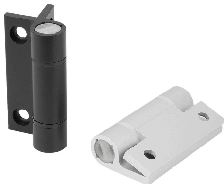
带闭锁弹簧的铰链